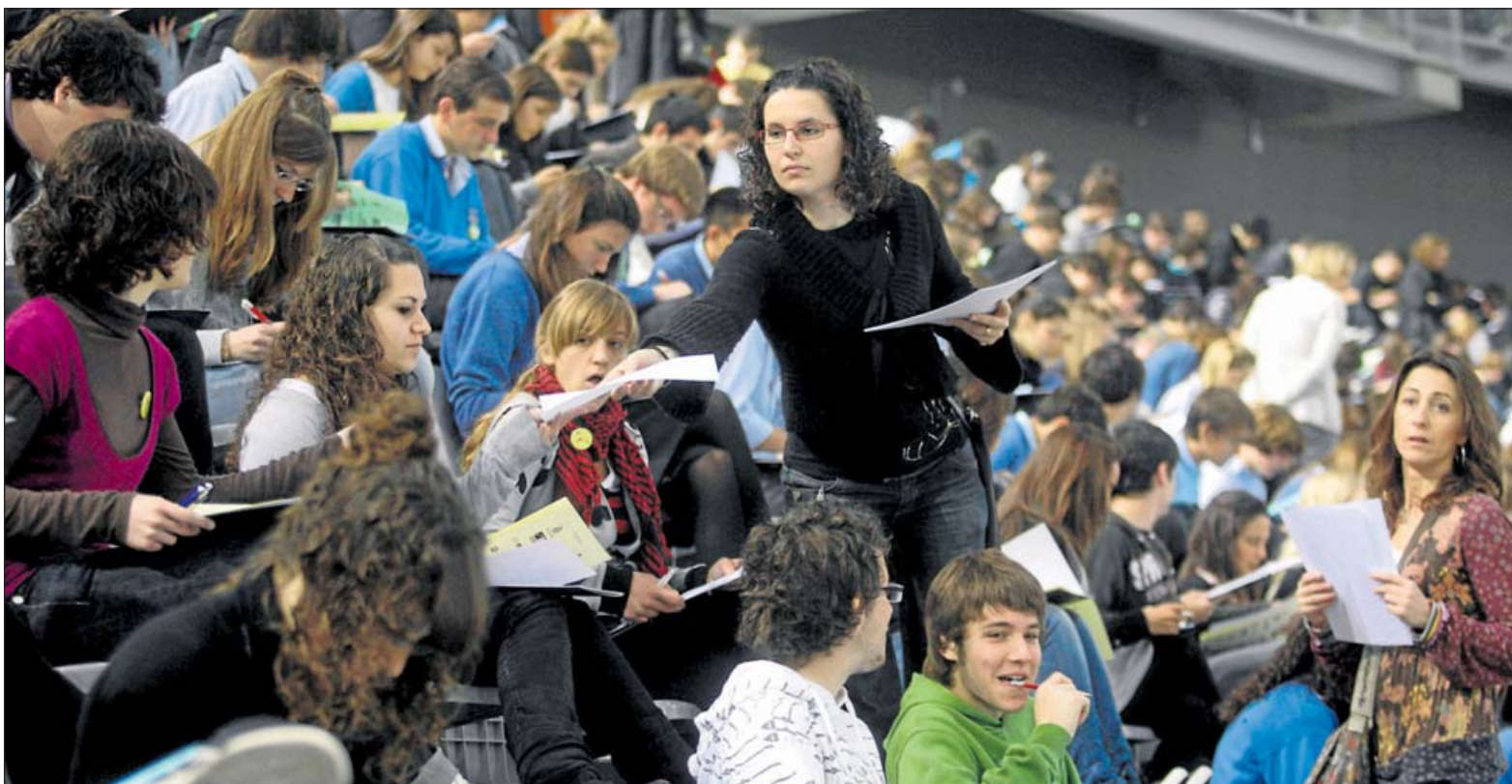
MATEMÁTICAS SIN CALCULADORA. Unos 4.500 alumnos de ESO y Bachillerato de Balears –2.300 de ellos en el Palma Arena– se sometieron ayer a las pruebas Cangur que enfrentan a los estudiantes a unos 30 problemas de matemáticas. “Sin calculadora no somos nada”, se lamentaba una de las participantes que reflejaba el sentir de buena parte de los congregados en la macroinstalación deportiva. ● PÁGINA 8

La memoria judicial de 2008 refleja las consecuencias de la crisis económica. En un año se pasó de 5.358 casos registrados a 7.410, un 40 por ciento más. ● PÁGINA 5