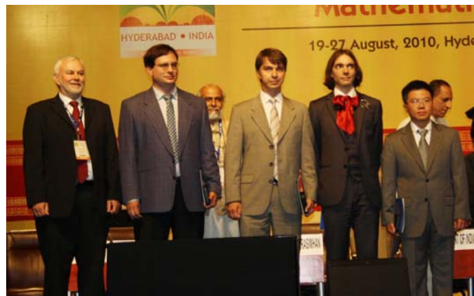
El Secretario de la IMU junto con los cuatro galardonados con la Medalla Fields

La Presidenta de la República entregó las Medallas Fields, el Premio Nevalinna, el Premio Gauss y el Premio Chern a los galardonados. Las Medallas Fields han correspondido a los profesores Elon Lindenstrauss (Universidad Hebrea de Jerusalén y Universidad de Princeton), Ngô Bảo Châu (Universidad París Sur, Orsay), Stanislav Smirnov (Universidad de Ginebra) y Cédric Villani (Escuela Normal Superior de Lyon e Instituto Henri Poincaré de París).