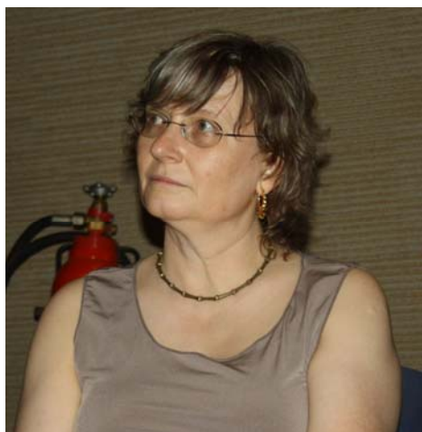
Ingrid Daubechies, presidenta de la IMU