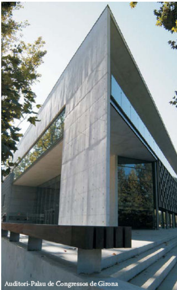
Auditori-Palau de Congressos de Girona