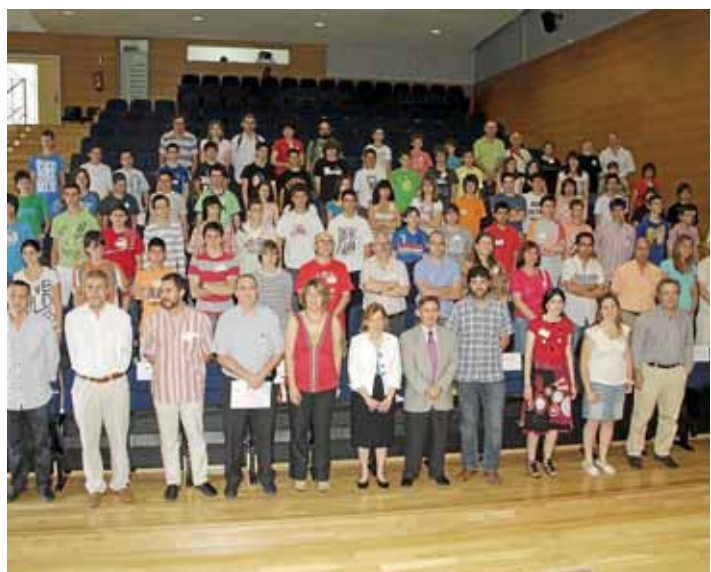
Els participants en l'Olimpiada Matemàtica, ahir a la UIB.